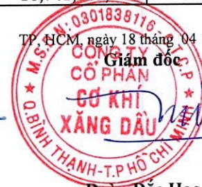
Đoàn Đắc Học